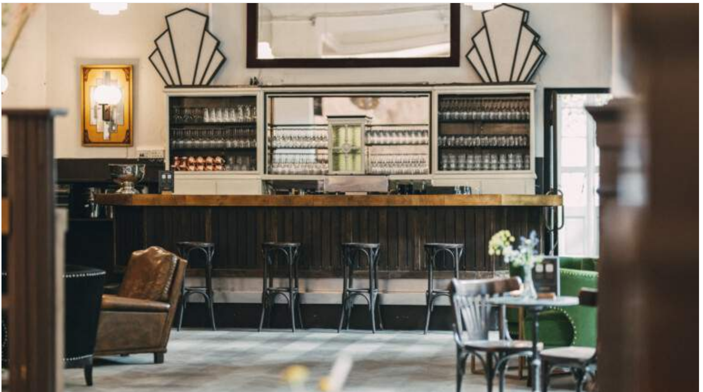
Fotograf und Immobilien-Investor Yoram Roth ist neuer Besitzer des Traditionsladens. Er eröffnet das Haus nur relativ kurz – geplant ist eine große Sanierung 2022

Traditionelle Speisen wie Buletten mit Senf (7 Euro), Rollmops (1,50 Euro) oder Blutwurst vom Ritter in Neukölln mit Linsen, Kartoffelstampf, Apfel und Röstzwiebeln (18,50 Euro) stehen auf der Speisekarte. Pizza gibt's nicht mehr – der Ofen wird jetzt für Flammkuchen angeheizt.